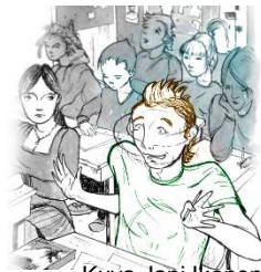
Kuva Jani Ikonen