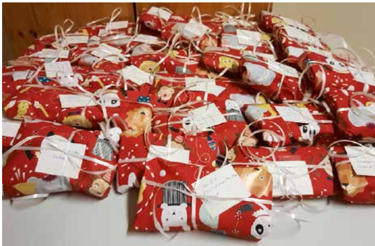
Suomussalmen osaston vapaaehtoiset kutoivat villasukkia Hyvä Joulumieli -lahjakorttien mukana annettavaksi.

Suomen Punainen Risti tarjoaa omaishoitajille ryhmätoimintaa, virkistystä, koulutusta, ohjausta, neuvontaa ja henkistä tukea. Toiminnan tarkoituksena on ylläpitää omaishoitajien kokonaisvaltaista hyvinvointia ja ehkäistä omaishoitajien uupumista. Punaisen Ristin järjestämä omaishoitajia tukeva toiminta on suunnattu kaikille läheistään hoitaville riippumatta siitä, saako omaishoitaja kunnallista omaishoidon tukea.