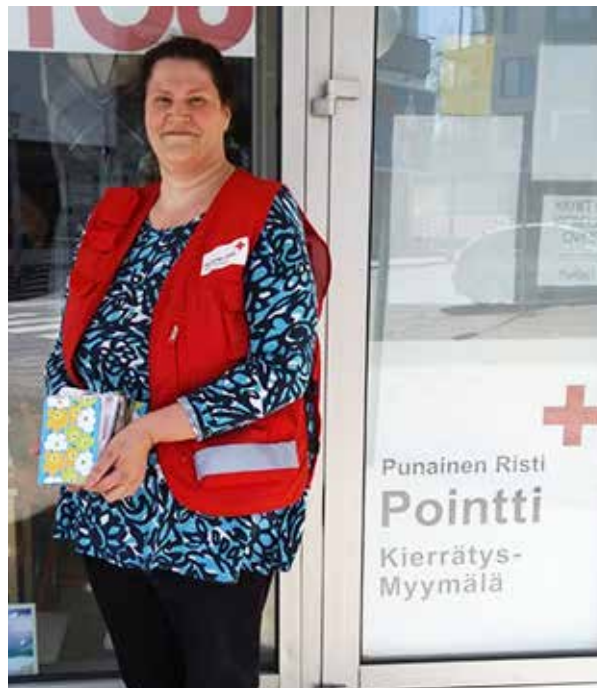
Raahen osaston vapaaehtoiset ilahduivat postikorteilla palvelukotien ikäihmisiä koronakevään aikana. Kortit saatiin lahjoituksena Kartolta.

Jokainen Punaisen Ristin ystävöitymisenä vapaaehtoinen on koulutettu tehtävänsä. Peruskursin suorittaneen vapaaehtoinen voi lähteä mukaan ystävöitymisenä, mutta toimintamuodosta riippuen sopivan jatkokurssin käyminen on erittäin suositeltavaa. Ystävöitymisenä peruskurssin ja järjestettiin 11 kpl ja jatko- sekä täydennyskou-