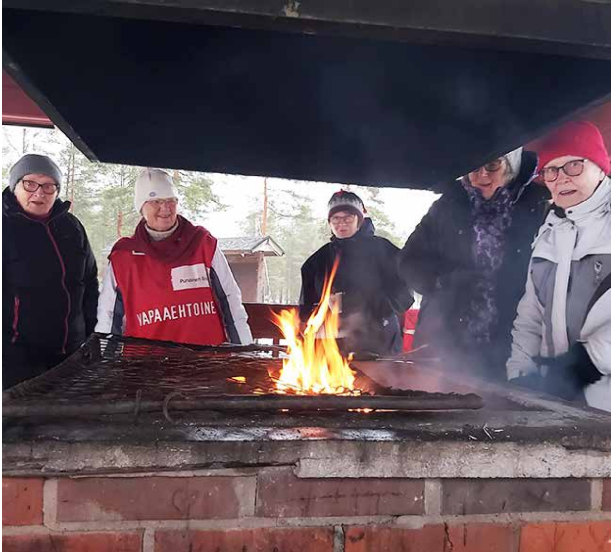
Oulunsalon terveyspisteen vapaaehtoiset virkistäytymässä makkarapaistossa.

nen valtakunnallinen puhelinauttamisen tehtävä liittyi korona-apuun ja toinen Vastaamon tietomurron johdosta avatun auttavan puhelimen tehtäviin. Henkisen tuen peruskursseja järjestettiin kaksi, joista toinen verkkokurssina etänä. Henkisen tuen alueellinen tapaaminen järjestettiin alkuvuodesta 2020, joka oli Oulun alueen tapaaminen. Yksi tapaaminen järjestettiin marraskuussa verkossa.