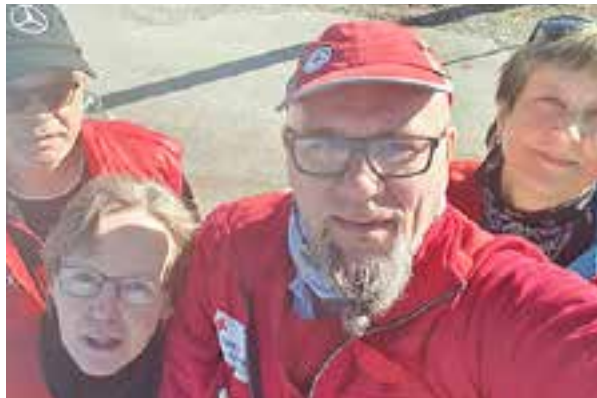
Kainuun vapaaehtoisia korona-avussa.

Oulun piiri on jaettu maantieteellisesti kuuteen valmiusalueeseen: Kainuu, Koillismaa, Oulu, Oulun eteläinen, Jokilaaksot sekä Merellinen jokilaakso. Alueellisen valmiuden tavoitteena on jaettujen resurssien avulla taata tasalaatuisempi auttamiskyky koko Suomen alueella, sekä vastata alueellisiin uhkiin alueen erityispiirteiden mukaisesti.