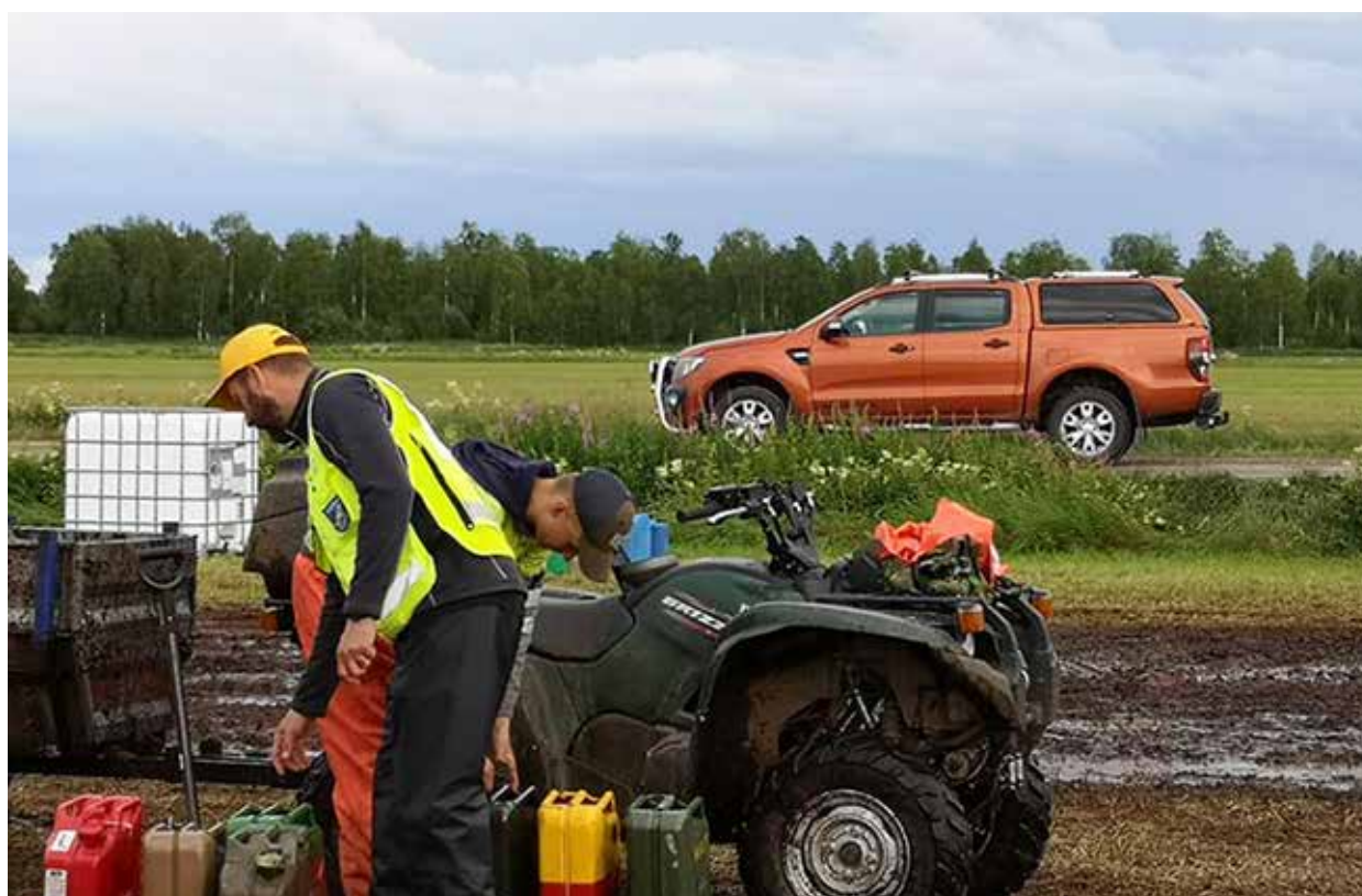
Muhoksen metsäpalojen sammuttamiseen osallistui suuri joukko vapaaehtoisia.

ka eivät vaatineet välitöntä lähtöä. Poliisi hälytti Vapepan apuun 38 kertaa, sosiaali- tai terveys-toimen viranomaisen 2 kertaa. Pelastuslaitos 1 ja loput 3 hälytystä tulivat muilta tahoilta. Kaiken kaikkiaan Vapepan hälytyksiin Pohjois-Pohjanmaan ja Kainuun alueella osallistui 896 henkilö (272, vuonna 2019) Pitkäkestoisia ja paljon henkilöresursseja vaativia tehtäviä olivat Muhoksen metsäpalot (6 päivää) ja Punaisen Ristin valtakunnalliset auttavat puhelimet korona-avussa ja Vastaamon tietomurtojutussa.