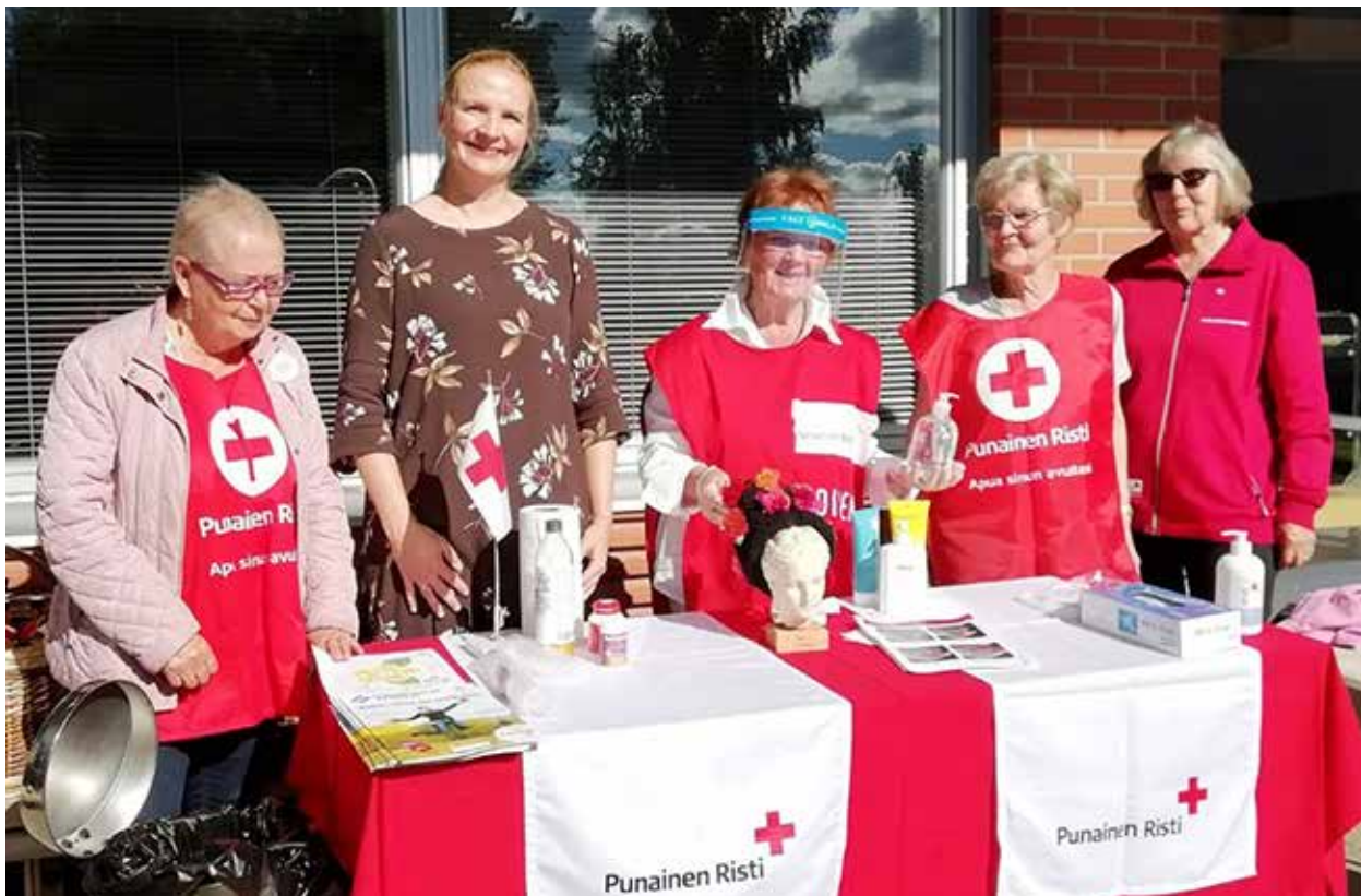
Omaishoitajien virkistystapahtuma Oulunsalossa syyskuussa 2020.

Vuonna 2020 omaishoidon tukitoiminnassa oli mukana Oulun piirin 8 osastoa. Koronapandemian aiheuttamista rajoituksista huolimatta uusia vapaaehtoisia lähti toimintaan mukaan. Oulun piirissä aloitti toimintansa Omaishoitajien juttuluuri, joka päivystää joka tiistai. Puheluun vastaavat henkisen tuen koulutuksen saanut vapaaehtoinen. Toimintaa kokeiltiin myös discord-alustalla mutta se ei saavuttanut juurikaan kohdeyhmää. Keväällä omaishoitajien tukitoiminta sai suuren korttilahjoituksen Karto:lta ja kortit jaettiin ystävävapaaehtoisten toimesta ikäkkäille henkilöille eri paikkakunnilla. Loppuvuodesta saatiin Tokmannilta rahalahjoitus, joka jaettiin tukitoimintaa toteuttavien piirien kesken. Lahjoituksella hankittiin suklaatervehdys, jonka sai Oulun piirin alueella 50 omaishoitajaa.