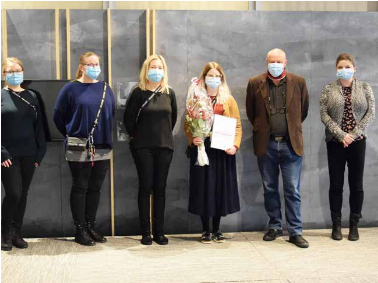
Ennakkoluuloton edelläkävijä tunnustus annettiin Oulun kaupungin pääkirjastolle.

valmistavissa luokissa kahdesti ja tavoitimme sitä kautta 17 oppilasta. Korona-rajoitusten tultua välitimme erikielistä korona-infoa eri toimijoille kuten kunnille ja muille järjestöille.