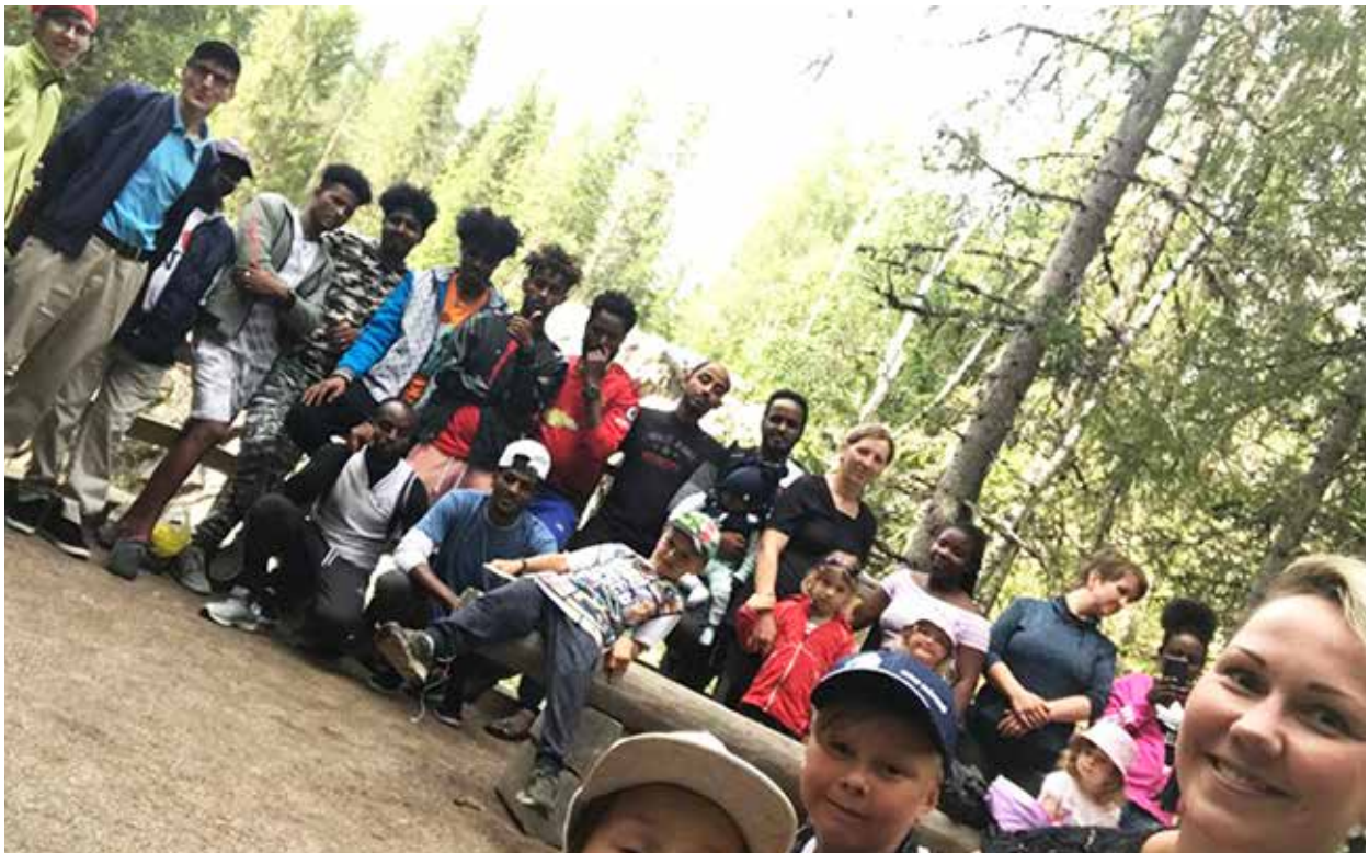
Utajärven kv-klubilaiset retkeilemässä.

Kotoutumista tukevaa toimintaa järjestettiin useilla paikkakunnilla ja uusia toimintaryhmiä perustettiin Kuusamossa ja Oulussa. Toimintamuotoina olivat mm. ystävöimintä, kansainväliset klubit, kielikerhot sekä asumisapu. Monikulttuurista toimintaa oli 7 osastossa vuoden 2020 aikana (2019,10). Punaisen Ristin toimintaa esiteltiin alkuvuodesta maahanmuuttajille Vuolteella