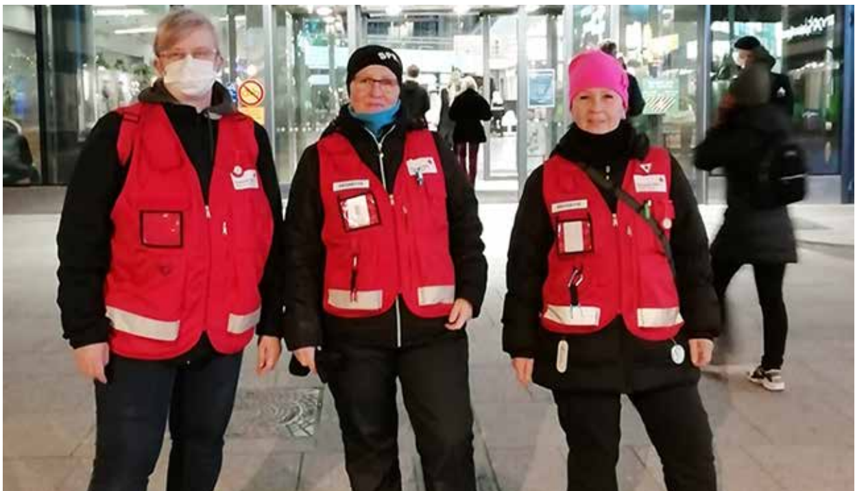
Päihdetyön vapaaehtoiset jalkautumassa Oulun kaupungin jalkautuvan nuorisotyön kanssa.

Henkisen tuen Lyhty-hälytysryhmä sai kuluvana toimivuonna yhteensä 3 hälytystä. Valtakunnallisissa tehtävissä piirimme alueelta on ollut henkisen tuen hälytysryhmäläisiä mukana puhelinauttamisen tehtävissä, joita oli kaksi. Toi-