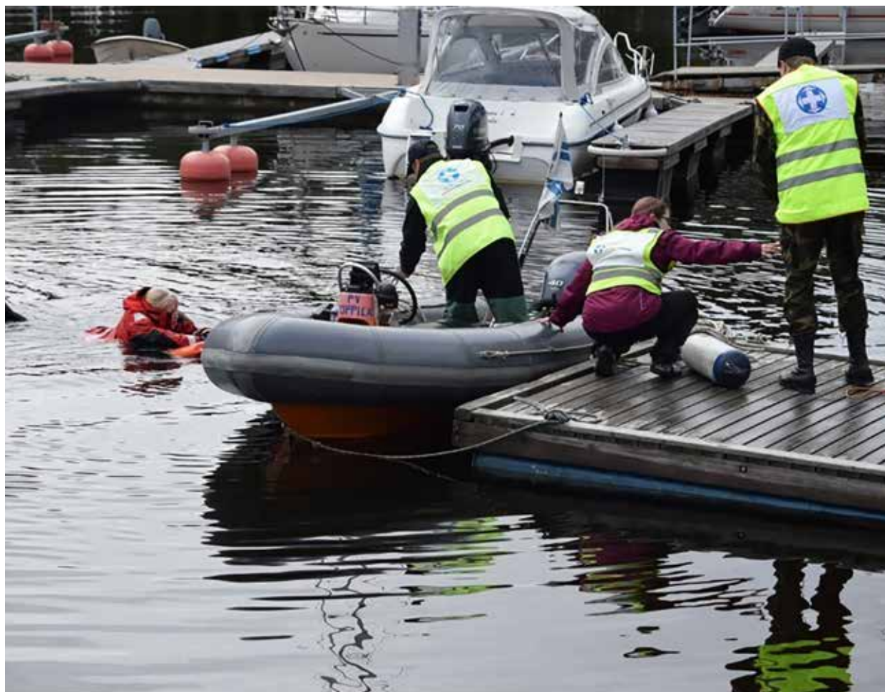
Oulun Meripelastajien rasti Suiston selviytyjät taitomestaruuskisassa.

Oulu-Koillismaan pelastuslaitoksen ja Punaisen Oulun piirin/ Vapepan yhteistyösopimus päivitettiin. Osallistuimme Oulun kaupungin SOTEn valmiusharjoitukseen tammikuussa. Olimme mukana syksyllä Oulun kaupungin järjestämässä evakuoinnin yhteistoimintaharjoituksessa Heinäpäähän palloiluhallilla. Jatkoimme yhteistyötä valtakunnallisessa OIL SPILL -hankkeessa. Järjestimme hankkeen kanssa yhteistyössä seminaarin yhteistyökumppaneille ja koulutuksia öljyntorjunnan vapaaehtoisille. Aktivoimme paikallisosastojen ensiapuryhmiä muutoksessa ensiapu- ja valmiusryhmiksi.