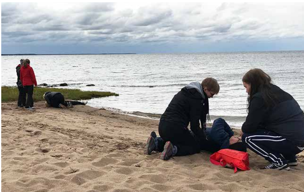
Ensiapuharjoituksia nuorten viikonloppussa.

Syksyllä 2019 järjestettiin myös nuorten viikonloppu Oulunsalossa, jossa osallistujia oli 24. Viikonlopun aikana tutustuttiin kattavasti Punaisen Ristin eri toimintamuotoihin.