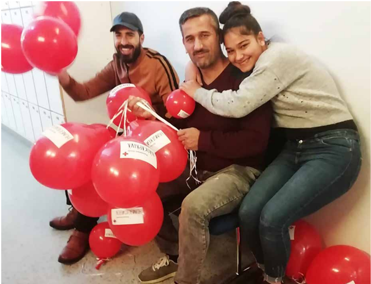
Kotoutumisen tuki -tapahtuma Suomussalmella.