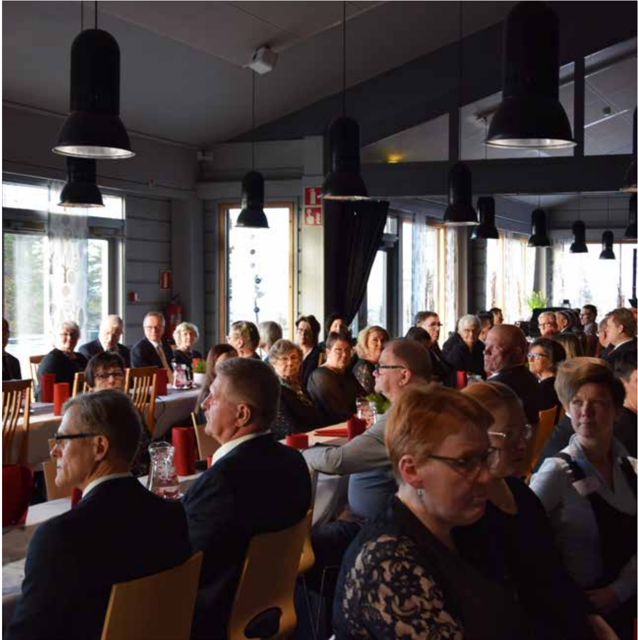
Järjestöseminaari- ja vuosikokous viikonloppu 2019.