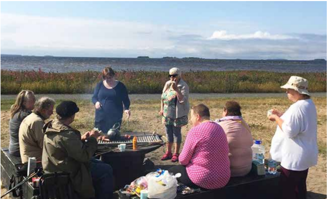
Kävelyretken makkaranpaistotauolla Toppilassa.

Vuonna 2019 toimintaa jatkettiin Oulun osaston ruoka-avussa Meri-Toppilassa, jonne hankkeen vapaaehtoiset jalkautuivat 15 kertaa (2018, 6). Toppilan ruokajakelussa järjestettiin tapahtumia sekä kutsuttiin vieraita pitämään infotilaisuuksia palveluistaan. Jonossa myös jaettiin ruokaohjeita ja kutsuja hankkeen tapahtumiin yhteensä noin 700 jaetun esitteen verran. Tarkkaa kohtaamisten määrää on vaikea laskea.