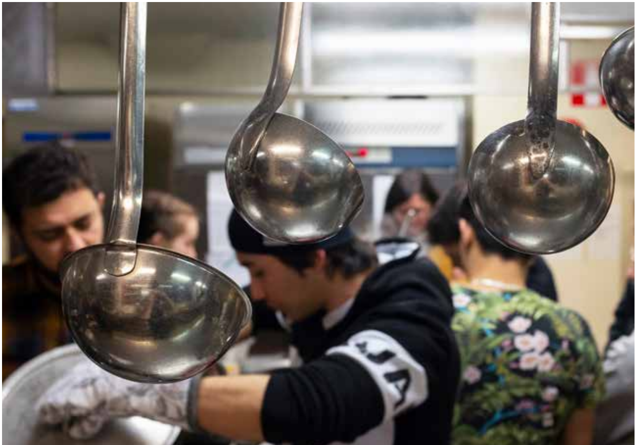
Kuusamon kansainvälinen klubi.

Kävimme kertomassa toiminnastamme eri kouluasteilla, harrastusryhmissä, työpaikoilla ja eri verkostoissa. Vierailuja tehtiin 11 ja niillä tavoitettiin suoraan noin 520 henkilöä.