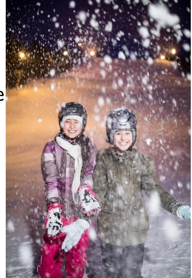
Kuva: SPR, Anna-Katri Hänninen