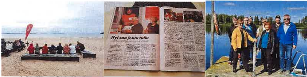
Kuvat: Hyvinvointipäivät Yyteri, Avun Maailma ja vapaaehtoisten seminaari Ikaalinen