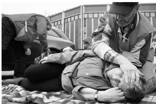
Keravan osasto harjoitteli viime vuonna ensiapua pyörän auton kolaritilanteessa.

Tapahtumissa kannattaa jakaa ICE- ja arvonta/yhteydenottokortteja. Niistä saatuja yhteystietoja voimme käyttää muun muassa uusien jäsenten hankkimiseen. Ammattitaitoisen telettimme yhteydenotot on otettu hyvin vastaan!