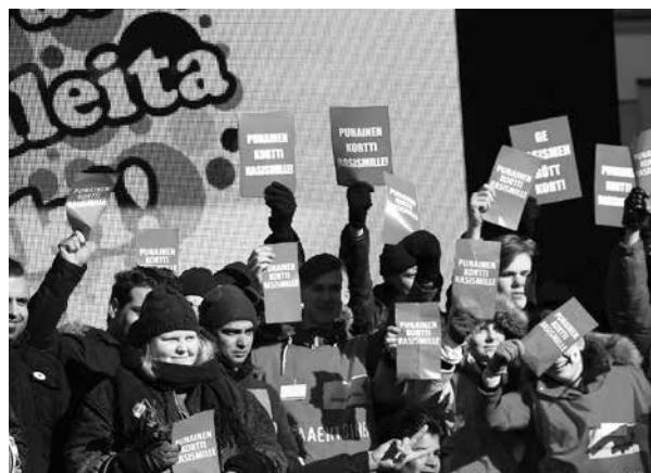
Oulu Loves Me -tapahtuma avasi Rasismien vastaisen viikon nostamalla punaisen kortin rasismille.

Tulijan tukena -lyhytkurssi pidettiin Hyrynsalmella, ja mukana oli myös suomussalmelaisia. Kuusamossa järjestettiin pääsiäisen aikaan vapaaehtoisten ja vastaanotto-keskuksen henki-