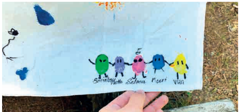
Leiri järjestetään vuosittain ja siellä opetellaan ensiapua, uidaan ja saunotaan, leikitään, lauletaan ja nautitaan yhdessä olost, Punaisen Ristin hengessä.