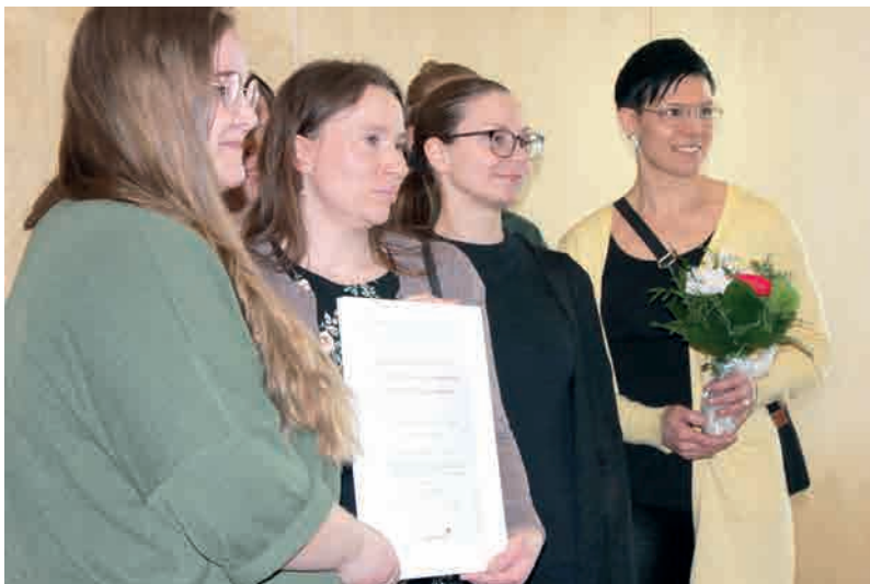
Kyynämöisten koulun henkilökunta iloitsi tunnustuksesta.