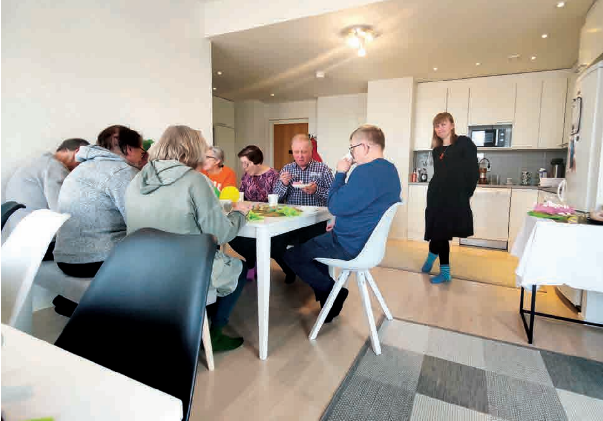
Tällä hetkellä Seinäjoen Rikulla on viitisentoista vapaaehtoista. Rikosuhripäivystyksen toiminta perustuu anonyymiyteen.