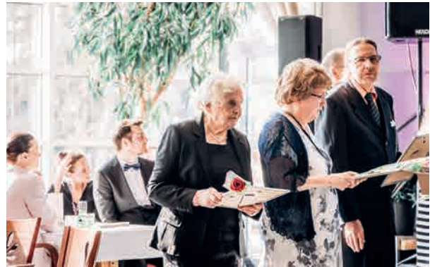
Useita pitkän linjan vapaaehtoisia palkittiin gaalassa.