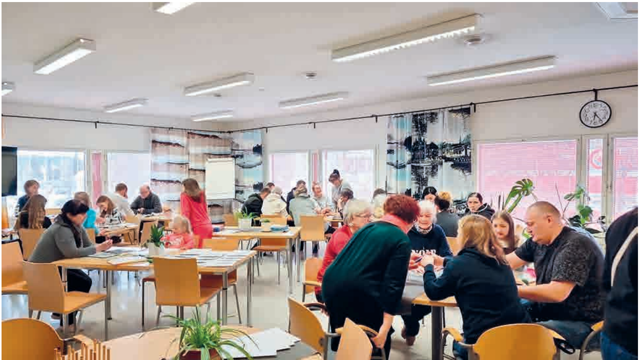
Juttelu-caféssa Saarijärvellä asuvat eri kansallisuuksien edustajat voivat tutustua toisiinsa.

Oppilaitosyhteistyö Saarijärven Yhteinäiskoulun kanssa lähti mukavasti liikkeelle maaliskuussa, kun tukioppilaskurssilaiset kävivät tutustumassa osaston toimintaan. Samalla sovittiin, että tulevaisuudessa yritetään mahdollistaa viikon TET-jaksoja hankekoordinaattorin ohjauksessa.