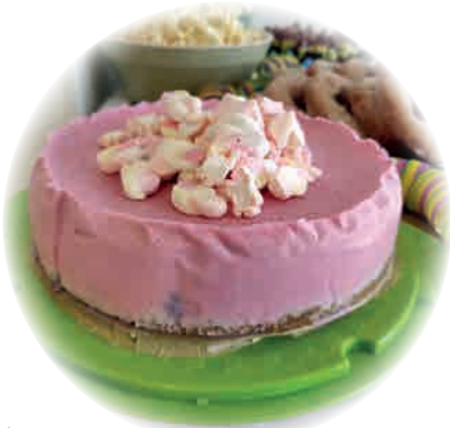
Seinäjoen Rikosuhripäivystyksellä oli toukokuussa pöytä koreana.

Kurssin käyminen ei edellytä vapaaehtoiseksi ryhtymistä.