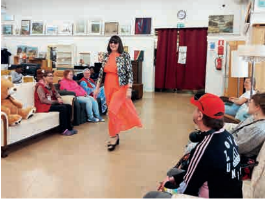
Vaasan SPR-Kirppiksellä järjestettiin äitienpäivänä muotinäytös.