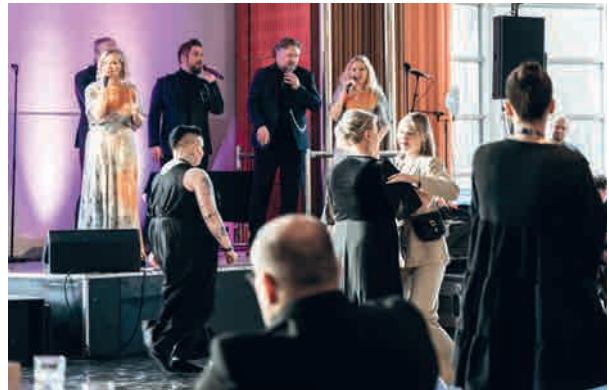
Lauluyhtye Club for Five esiintyi juhlassa.