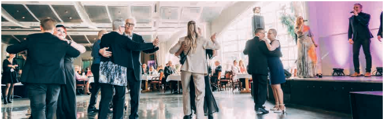
Tanssitaitoisimmat juhlijat valtasivat lattiaa.