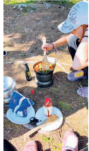
Trangiolla valmistettiin MAPO-porukan kanssa ruokaa.

Näin nuoret kertovat MAPO-koulutuksesta omin sanoin: