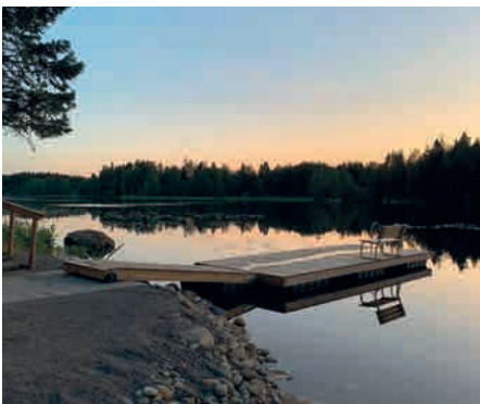
Spärrä Äksöni -leiri järjestettiin tänä kesänä Kalajaisten leirikeskuksessa Ilmajoella 9.-13. heinäkuuta.

Leirin ohjaajaporukka oli todella mukava, joten olon tunsin helposti turvallisiksi ja hyväksi omana itsenään. Leirille oli kiva tulla niin ensimmäistä kuin useampaakin kertaa.