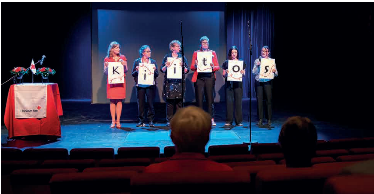
Omaishoidon tukitoiminnan työntekijöiden päätössanat.

Teksti: Teija Matalamäki