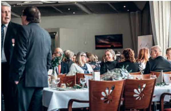
Härnä Kylpylän salissa oli mukava tunnelma.