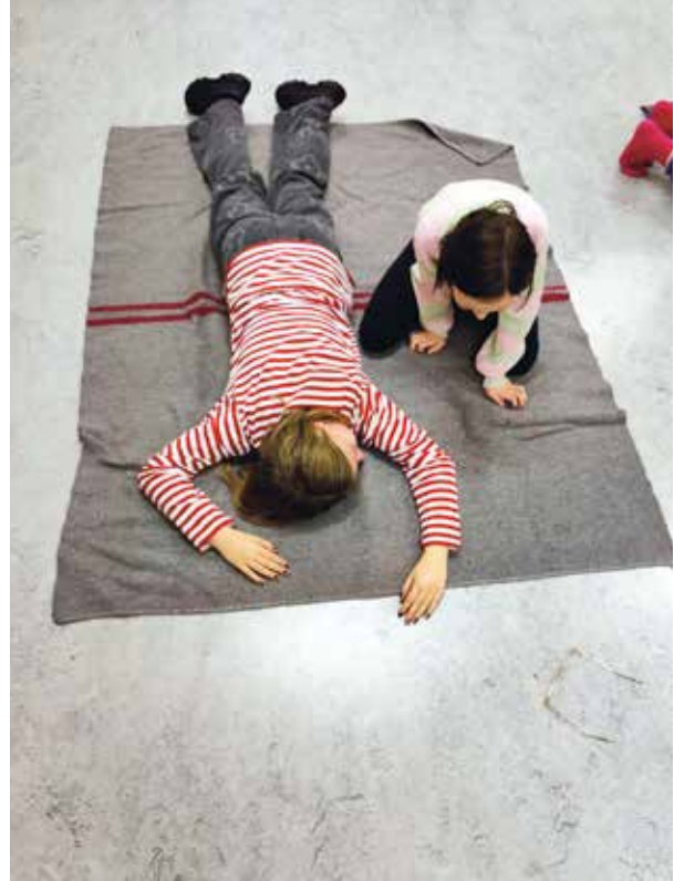
Epilepsiakohtauksen saanut potilas, jonka auttaja on "löytänyt".