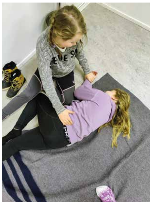
Kerrattiin kylkiasentoon kääntäminen ja harjoiteltiin voimien seuranta.