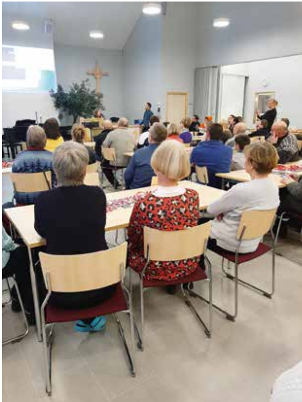
Uuraisissa ystävänpäivää juhlittiin yhdessä seurakunnan kanssa.