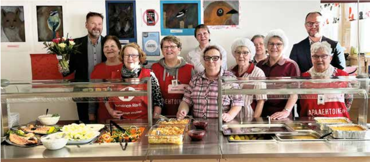
Kristiinankaupungissa syötiin yhteisöllinen lounas.