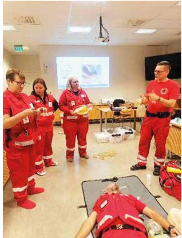
Laukaan ensivastepäivystäjiä viime syyskoulutuksessa.

tekemällä. Varsinaisia ensiapupäivystäjän peruskurssejaursseja järjestetään pari keväällä ja pari syksyllä, odotellessa kaikki uudet ovat harjoittelijoita.