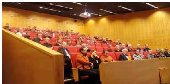
Valmiusavaus järjestettiin ensi kertaa Tuurissa. Seuraavan kerran tavataan 27.1.2024 samassa paikassa.

– Nyt pyritään kehittämään etsintään liittyvää laaja-alaista resurssointia ja sen hallintaa. Siitä on hyötyä niin poliisille kuin vapaaehtoisjohtajille.