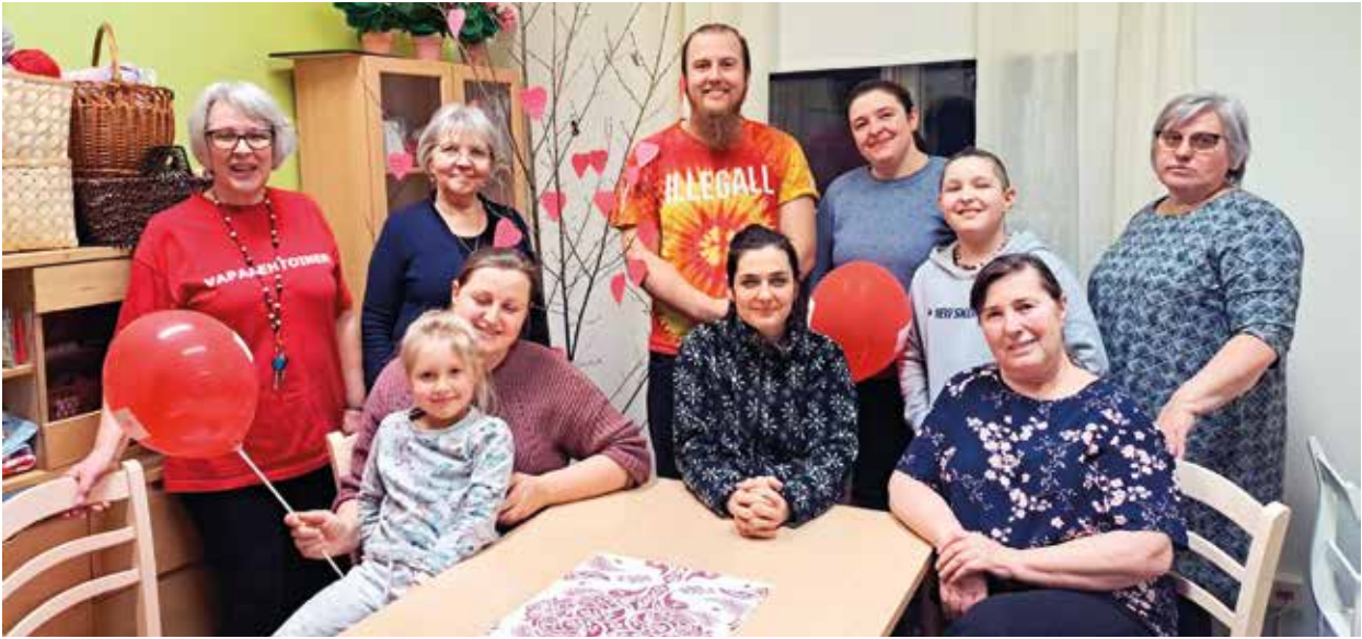
Alajärven kielikahvilassa teemana oli ystävyys.