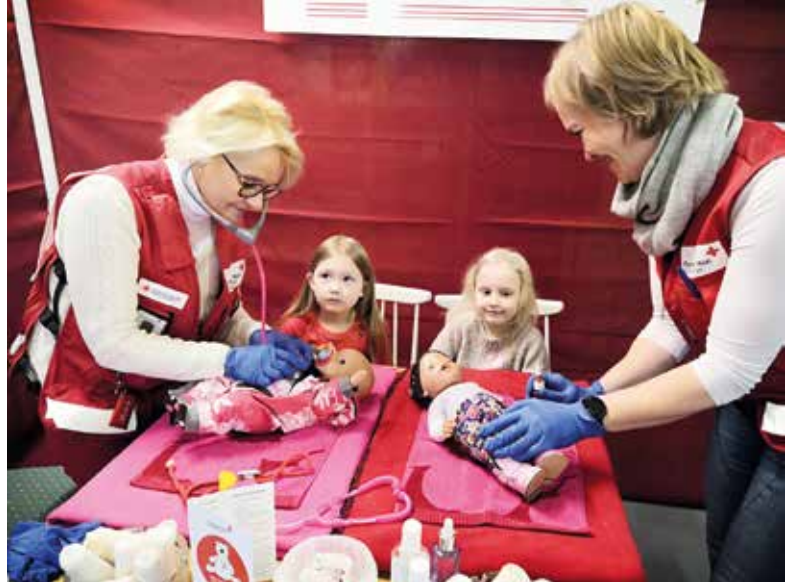
Pihtiputaan osaston Nallesairaala palveli perheen pienimpiä.