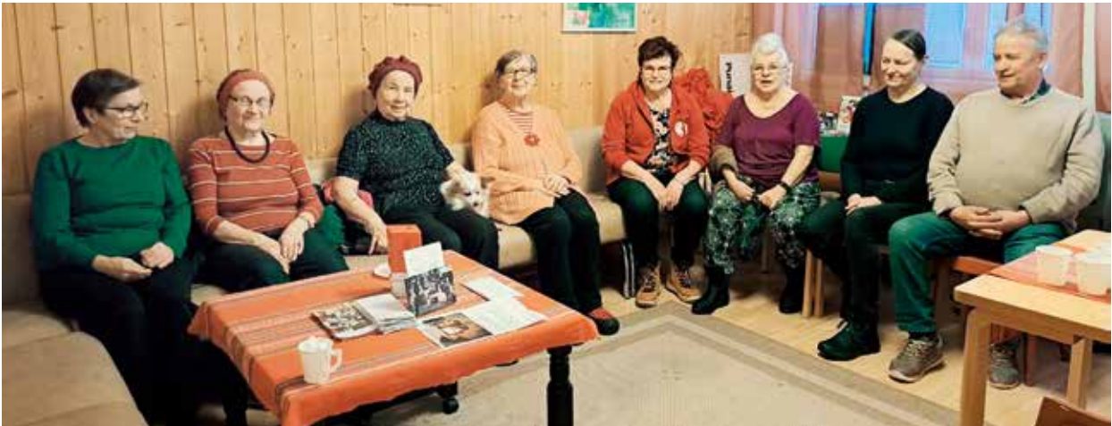
Jämsän osaston Koivutuvan terveystieteellä nautittiin kahvit.