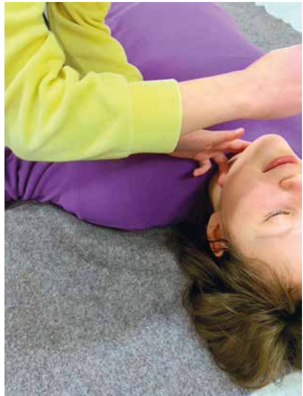
Potilaan tarkkailua ja hengityksen kulun seurailua.