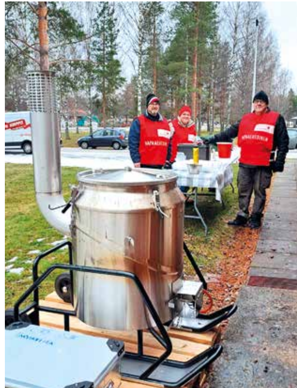
Kurikan osasto tarjosi keittoa ja kakkua.