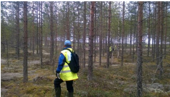
Etsintäharjoitus Rautavaaralla 24.5.2015

Tule mukaan toimintaan – ota yhteys paikallistoimikuntaan!