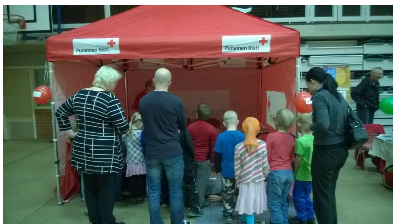
SPR:n osaston toiminta nousee paikallisesta tarpeesta.

Osastolla on nyt hyvät resurssit ja valmius auttaa mahdollisten kriisitilanteiden varalta. Kiitos tästä kuuluu kaikille Rautavaaran osaston jäsenille, vapaaehtoisille, sekä lahjoittajille.