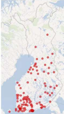
Harjoitukseen osallistuneet osastot

Harjoituksen aiheena oli auttaminen evakuintilanteessa. Harjoitus mahdollisti erilaiset harjoitusskenaariot liittyen tulipaloon, vesiliikenne-onnettomuuteen, tulvaan, vaarallisen aineen leviämiseen tai laajamittaiseen maahantuloon liittyen. Harjoitus koostui Punaisen Ristin osastojen järjestämistä paikallisista ja osastoalueiden alueellisista harjoituksista, joiden suunnittelua ja toteutusta piirit tukivat. Harjoituksia järjestettiin sekä toiminnallisina harjoituksina että pöytäpeliharjoituksina.