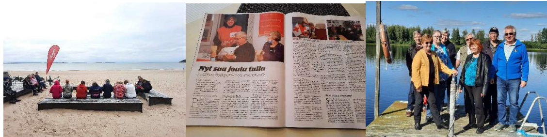
Kuvat: Hyvinvointipäivät Yyteri, Avun Maailma ja vapaaehtoisten seminaari Ikaalinen

Järjestimme kahdet hyvinvointipäivät omaishoitajille Yyterin virkistys hotellissa (osallistujia 18) sekä yhteistyössä Länsi-Suomen piirin kanssa Ähtärissä (osallistujia 20). Virkistystilaisuuksia ja retkiä järjestettiin yhteensä 27 erilaista. Omaishoitoperheiden kesäretkiä 11 ja joulujuhlia 12.