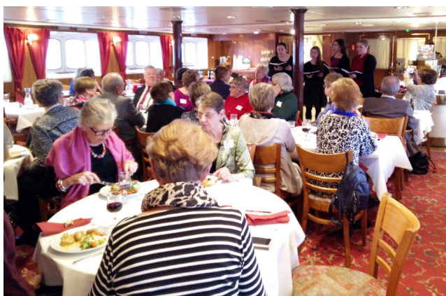
Rödakorsvänner på middag i s/s Bore, en kvartett från Florakören uppträder