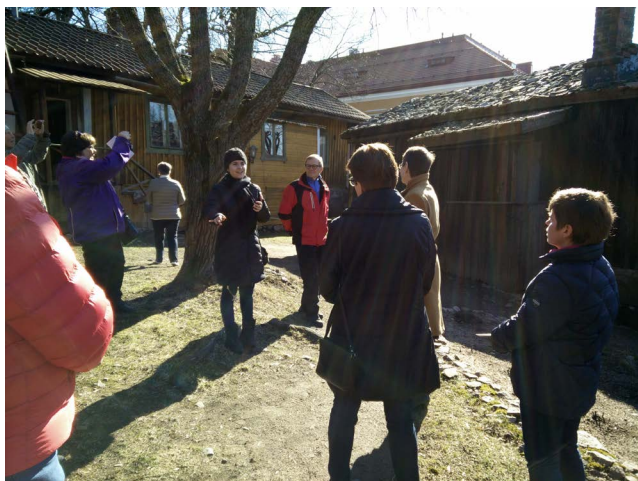
På söndagen besöktes hantverkarmuseet på Klosterbacken