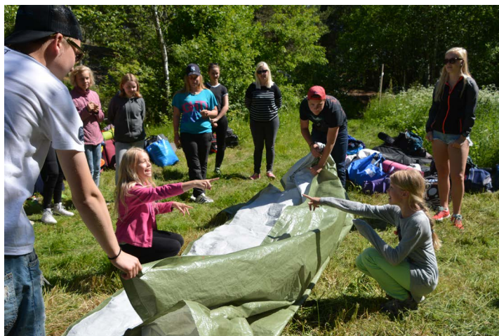
Namnlek i solen

Vårt läger hade tre temadagar. Det var team building, mångkultur och första hjälpen. Utöver det handlade det om ett samarbete mellan Åbolands och Ålands distrikt och lägret var