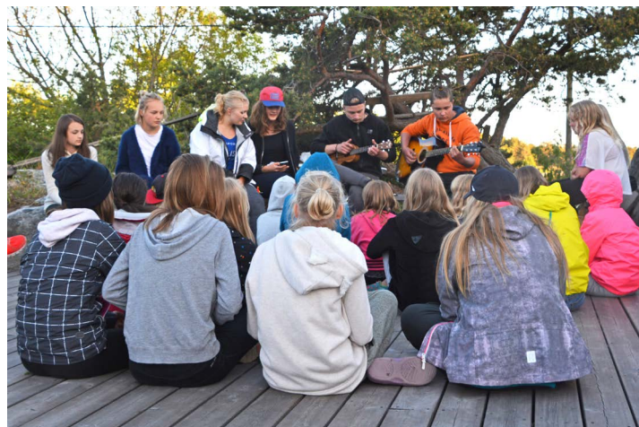
De yngre lägerledarna spelade sånger för oss en kväll, och fast vi inte hade någon lägereld infann sig den absolut rätta känslan

så som bara en 10-åring kan. Jag frågade vad det var och fick svaret "Ajattelin vain sitä, että pian leiri on ohi. Tulen kaipaamaan kaikki kaiverit, ja kotona ei ole aina jotain ohjelmaa". Vänner, jag kommer tydligen också att sakna det här, mycket.