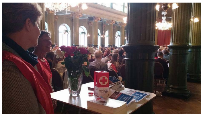
Åbo Svenska avdelning presenterar sin verksamhet under konserten

Konsertens repertoar bestod, som man förstod på konsertnamnet, av sånger på 20 olika språk. De olika sångerna har köerna stiftat bekantskap med under körturnéer till andra länder eller genom utländska körkontakter. Bland annat armenisk, finsk, haitisk och japansk folkvisa, psalmen Nearer, My God, to Thee på afrikaans, bön på un-