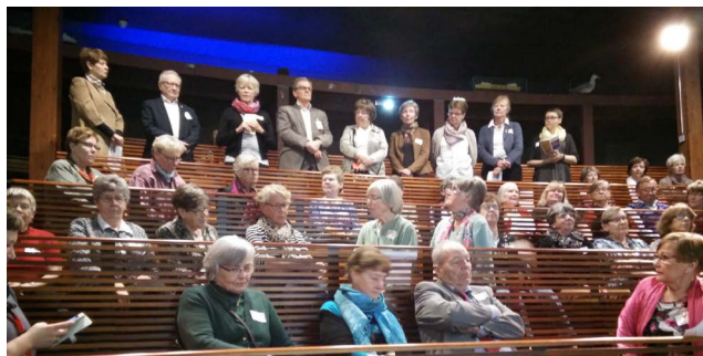
Avdelningarna presenterar sig. På bilden ser vi Åbo svenska avdelning berätta om hur vänverksamheten ser ut i deras avdelning.