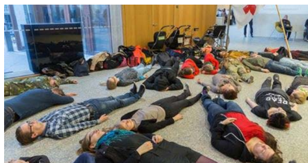
Tyst manifestation på Åbo stadsbibliotek

Evenemanget, som hölls på Åbo stadsbibliotek, gick ut på att frivilliga samlades på biblioteket och biblioteksbesökare informerades om evenemanget och bjöds med. Klockan 17.00 meddelades det att den tysta manifestationen börjar och alla deltagare lade sig ner på golvet. Var tionde deltagare var klädd i militärkläder för att symbolisera att endast en tiondedel av krigsoffren är militärer. Under 10 minuter låg alla tysta och stilla på golvet. Under