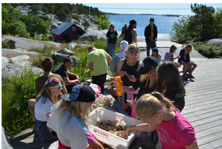
Som minne gjorde barnen amuletter av vad skärgårdsnaturen har att erbjuda

Jag hade inställt mig på att dra ett läger. Allt var planerat. Vad jag på något sätt inte hade förstått var att jag själv också skulle på nämnda läger – att jag efter en vecka skulle komma hem utmattad men lycklig, med nya vänner, nya minnen och nya ärr. Bäst vi gick från lägerplatsen till matsalen en dag var det ett barn som plötsligt såg så där melankoliskt ut,