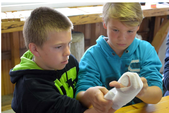
Vi fick öva på att förbinda sår i handen

På team building-dagen tog brännskärsborna ut oss i skogen för att i grupp lösa problem och springa genom hinderbanor. Barnen testade på att skjuta med pilbåge och blåsrör, solen sken och på kvällen när lugnet var återställt höll de musikaliska yngre ledarna konsert för oss på klipporna. På många sätt var