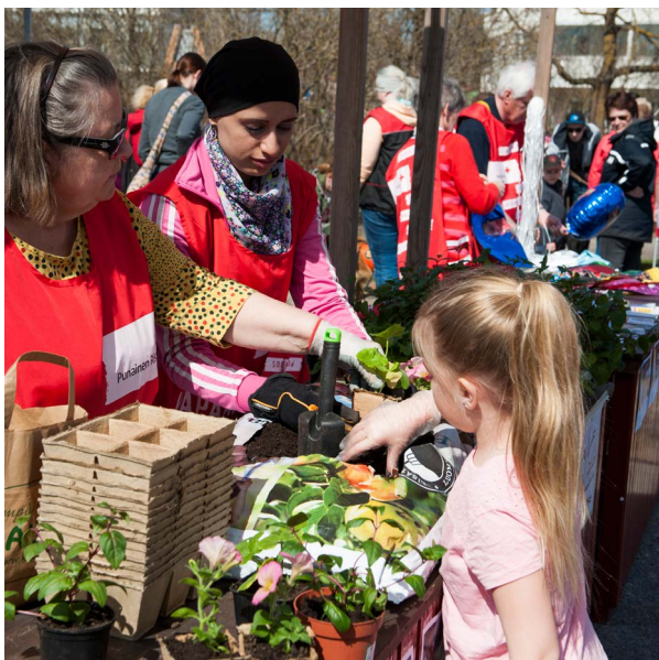
Tässä Punaisen Ristin kojussa 1. toukokuuta -jipossa lapset saivat ilmaiseksi istuttaa kasvin ja viedä sen kotiinsa

Toivottavasti Mäku-ryhmä jaksaa aktivoitua uudelleen syksyllä. Vapaaehtoista toimintaa tarvitaan uusien, mahdollisten pakolaisten ja turvapaikanhakijoiden saapuessa. Kaukaa, eri kulttuureista tulleiden naapuriemme kotoutuminen sujuu ehdottomasti parhaiten mielekkäässä vuorovaikutuksessa paikallisten kanssa - yhteisten harrastusten parissa.