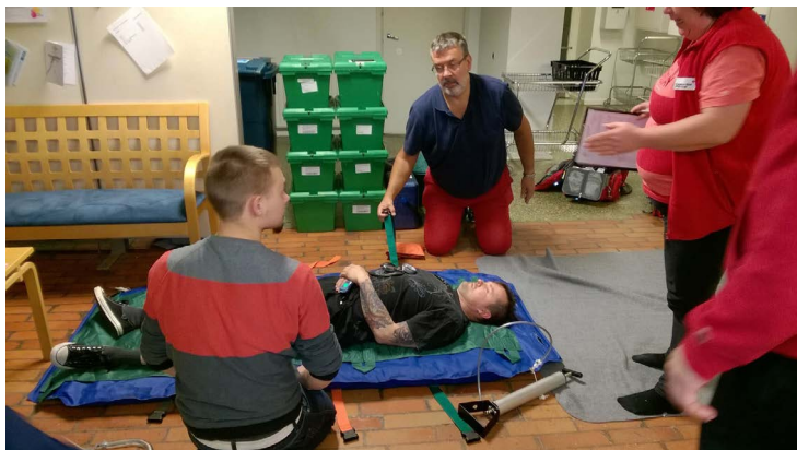
Kursen var fullspäckad med övningar

Saaristoavun ensimmäinen ensivastekurssi on ollut kursinjohtajan näkökulmasta mielenkiintoinen ja antoisa, koska osallistujia on kolmesta järjestöstä ja kurssia on käyty kahdella kielellä. Kurssilaiset ovat olleet innolla mukana ja oppimistavoitteet on saavutettu hyvin. Kurssilaisten taustat ovat olleet varsin erilaisia, mutta uskon, että kurssi on antanut jokaiselle reilusti lisää valmiuksia hätätilapotiin kohtaamiseen.