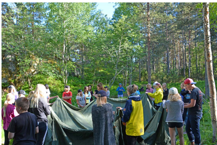
Alla hjälptes åt att sätta upp tälten vi bodde i

Visst var språken en utmaning, men de var långt ifrån ett problem. Vi var väl förberedda och efter bara några timmar av aktivt finskatalande flöt det på riktigt bra för mig också. Jag har aldrig varit överdrivet bra på finska, men under det här lägret kom jag att inse vilken enorm rikedom språkkunnighet är – jag var en superhjälte, en gud, ett geni som förstod allt som sades och kunde lösa konflikter så enkelt eftersom jag bara visste att nukkumaanmeno aika är läggdags. Klart att jag sade fel och använde knasiga verbformer, men det var inte poängen, kommunikationen fungerade. I takt med att lägret fortlöpte började också barnen tala friare. I vissa fall måste de ty sig till engelska för att förstå varandra – en del av mig tycker det är sorgligt att de här unga landsmännen inte kan kommunicera på de inhemska språken, men det är ett fänigt sätt att