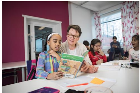
Kuva: Susanna Kekkonen