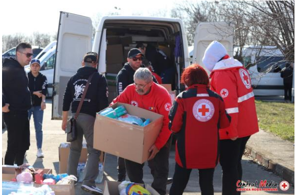
Kuvassa Punaisen Ristin vapaaehtoiset antamassa ruoka ja juoma apua Ukrainassa Romanian rajalla.

Muutaman vuoden tauon jälkeen olemmekin taas järjestämässä perinteisen Uusien jäsenten illan. Toivotamme kaikki osastomme jäsenet, jotka ovat kiinnostuneita kuulemaan enemmän eri toimintamuodoistamme terveilleiksi tapahtumaan. Viime vuosien aikana onkin osastoomme liittynyt runsaasti uusia jäseniä. Ehkä sinäkin löytäisit ryhmistämme itsellesi sopivan vapaaehtois-tehtävän!