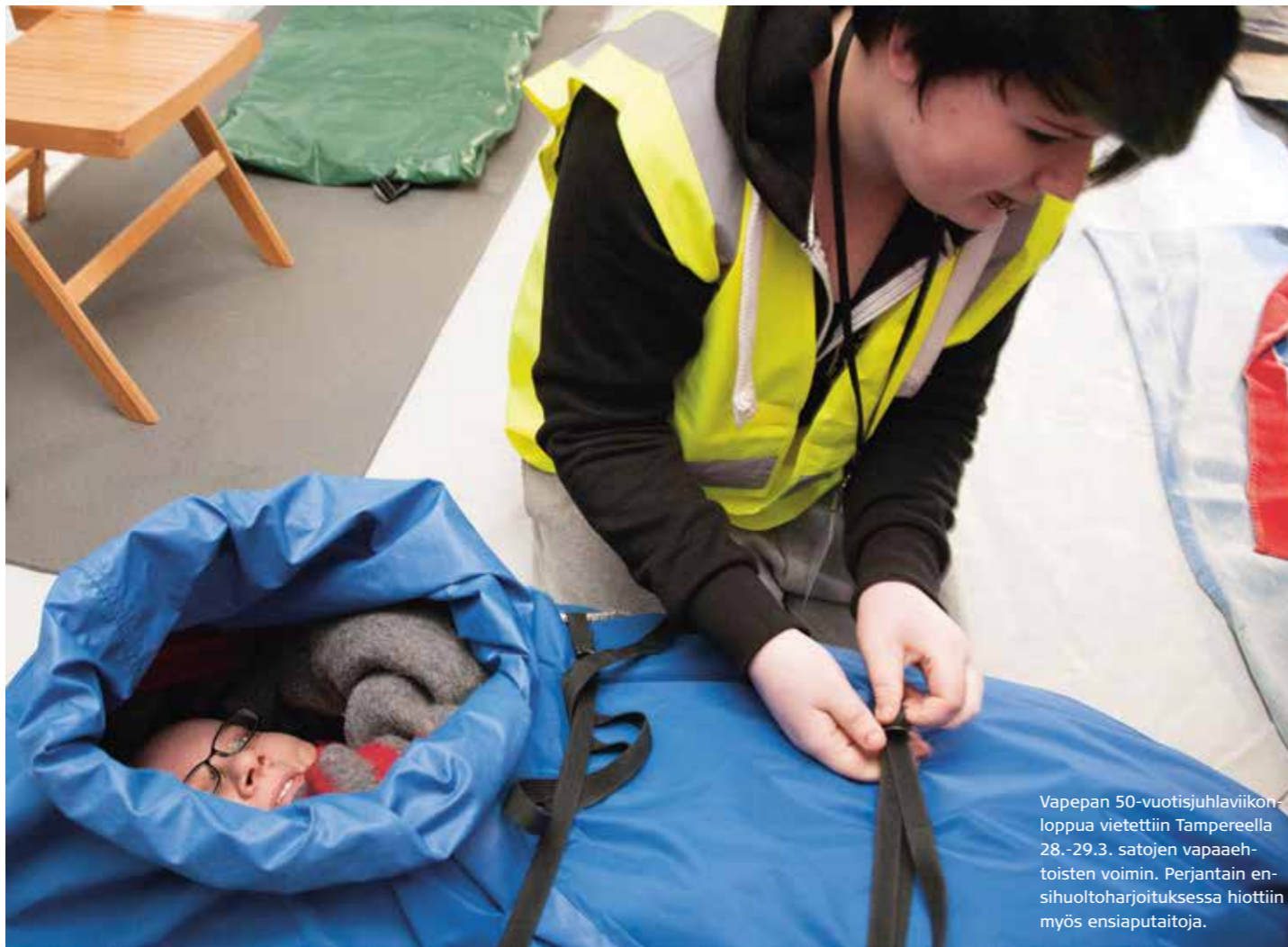
Vapepan 50-vuotisjuhla viikonloppua vietettiin Tampereella 28.-29.3. satojen vapaaehtoisten voimin. Perjantain ensihuoltoharjoituksessa hiottiin myös ensiaputaitoja.