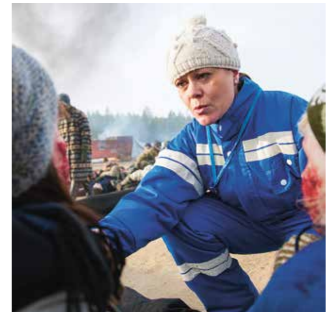
Kannattaa rohkeasti mennä lähelle kuvattavaa. Kuvan päähenkilö on noin puolen metrin päässä kuvaajasta.

Vapepa käynnistää syksyn alussa valokuvakilpailun. Pysy kuulolla: vapepa.fi ja facebook.com/vapepa .