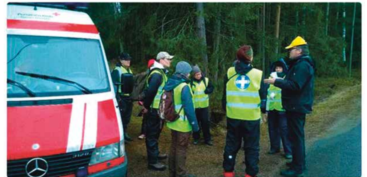
Turun Vapepa käyttää Twitteriä muun muassa tunnelmien välittämiseen tapahtumien ja koulutusten aikana.

Jos metsään haluat mennä nyt, niin takuulla yllätyt. Siellä on #etsintäkurssi liikkeellä! #Vapepa #Turku