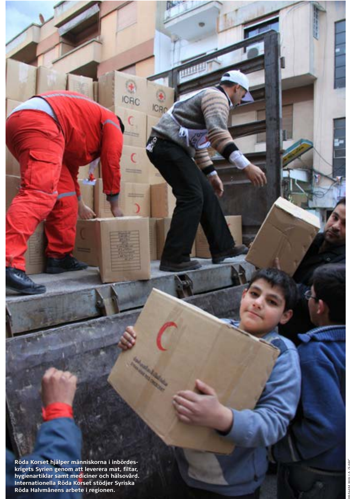
Röda Korset hjälper människorna i inbördeskriget i Syrien genom att leverera mat, filter, hygienartiklar samt mediciner och hälsovård. Internationella Röda Korset stödjer Syriskas Röda Halvmånens arbete i regionen.