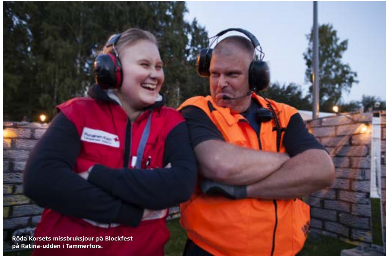
Röda Korsets missbruksjour på Blockfest på Ratina-udden i Tammerfors.