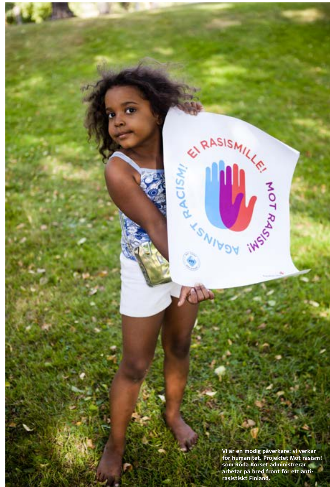
Vi är en modig påverkare: vi verkar för humanitet. Projektet Mot rasism! som Röda Korset administrerar arbetar på bred front för ett anti-racistiskt Finland.

Vilket löfte skulle du och din avdelning kunna ge och vilka mål skulle ni vilja ställa upp för er själva?