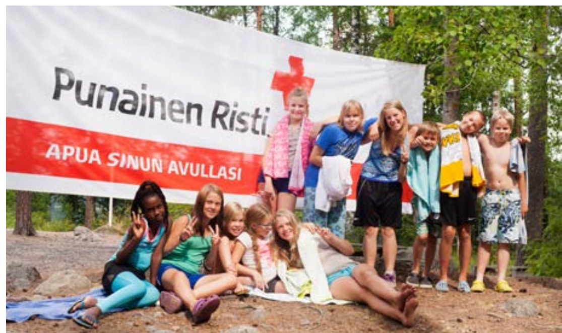
Att vara medlem i Röda Korset är ett ställningstagande för humanitet och omsorg. Finlands Röda Kors avdelning i Janakkala ordnade sommaren 2014 ett första hjälpen-läger. I lägret deltog 14 barn och ungdomar.